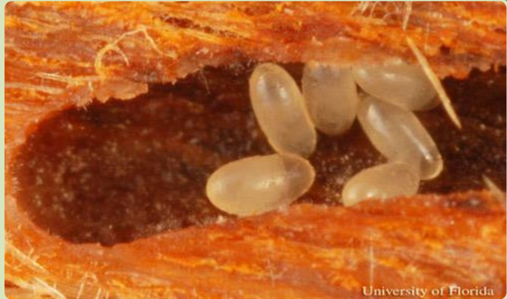
Huevos en galería.