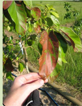
Florida Department of Agriculture and Consumer Services, Division of Plant Industry, S/A.