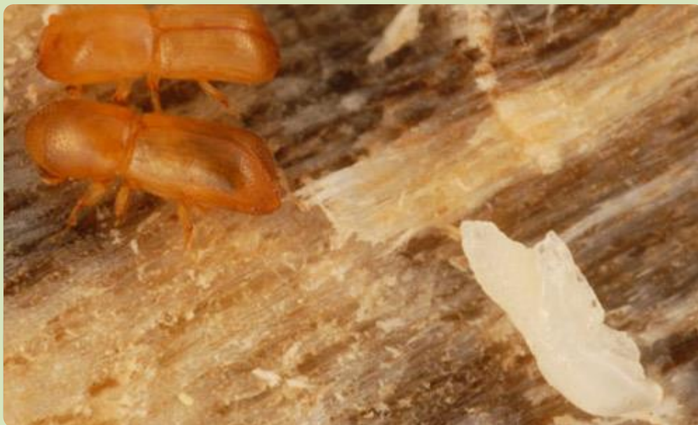
Dos escarabajos recién emergidos (exoesqueleto todavía en oscurecimiento) cerca de una pupa blanca de la que el adulto aún no ha surgido.